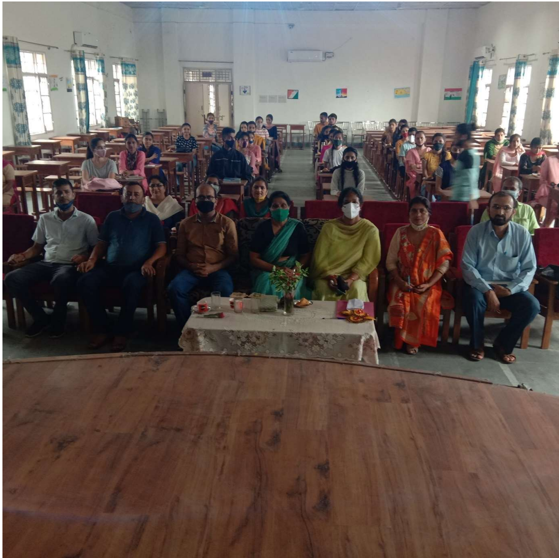
Photograph 8 staff and students attending workshop