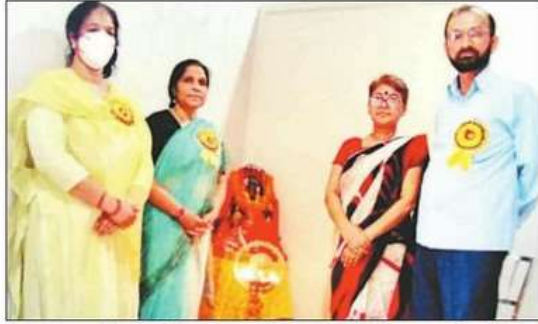
पांवटा कॉलेज में हिंदी पत्राचार की महत्ता पर आयोजित एक दिवसीय कार्यशाला के दौरान मौजूद शिक्षक।